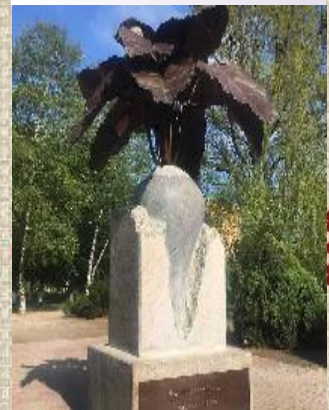
Пам'ятник буряку в Миколаєві