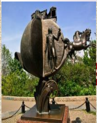
Пам'ятник апельсину в Одесі