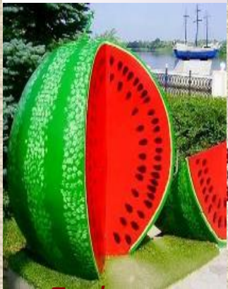
Пам'ятник кавуну в Голій Пристані