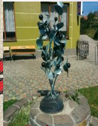
Пам'ятник чорниці на Закарпатті