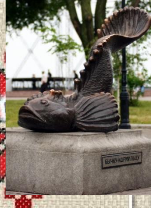
Пам'ятник «Бичку-годувальнику» в Бердянську