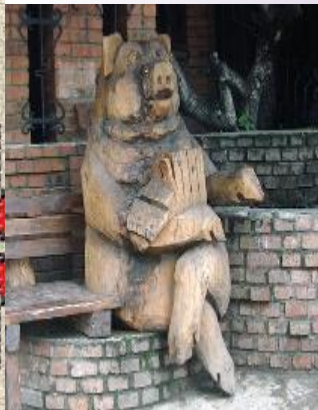
Пам'ятник салу в Луцьку