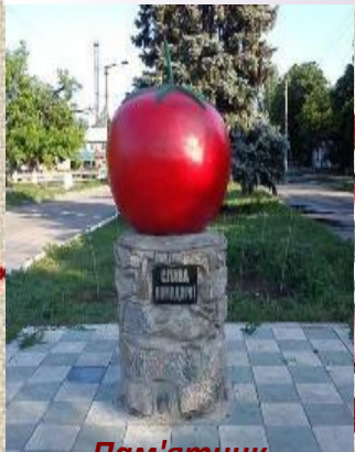
Пам'ятник помідору в Кам'янці-Дніпровській