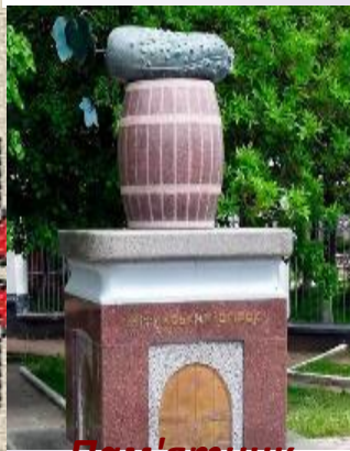
Пам'ятник огірку в Ніжині