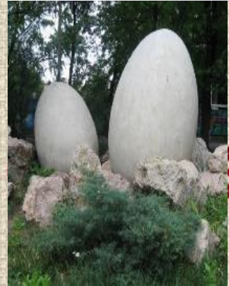
Пам'ятник яйцю в Харкові