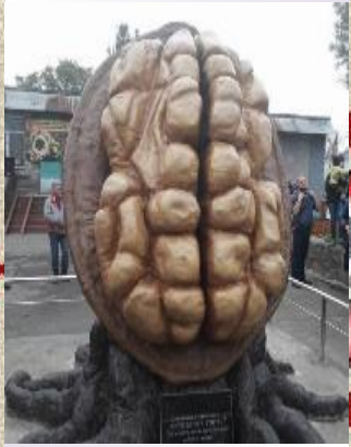
Пам'ятник горіху на Дніпропетровщині